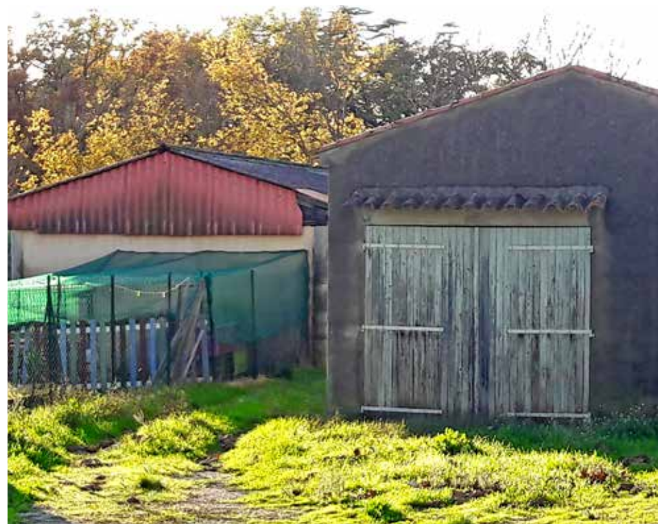
DEUX HANGARS A DEMOLIR

Ce projet qui s'élève à environ 1 100 000€ H.T. (travaux et prestations intellectuelles), comme l'a précisé la délibération du conseil municipal du 27 mai 2019, sera achevé pour l'été 2021. D'ores et déjà, le maître d'œuvre a été désigné suite au lancement d'un marché public en juin dernier. Cette équipe pluridisciplinaire a finalisé l'esquisse. Le premier coup de pioche symbolisant le commencement des travaux aura lieu au 1er trimestre 2020 et correspondra notamment à la démolition des 2 hangars situés à côté du centre de loisirs. Il s'agit de 2 constructions en très mauvais état qui accueillent du stock de matériel.