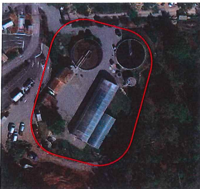
Lieu d'implantation des travaux